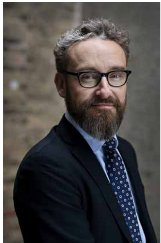
Ole Birk Olesen Transport-, bygnings- og boligminister

Den digitale udvikling i byggeriet er et fælles anliggende og strategien er startskuddet til en fornyet og fokuseret indsats.